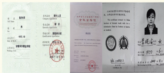
教师相关资格证书