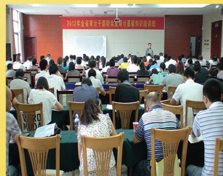
全省审计干部财会及审计基础知识培训