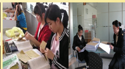
学生在工作岗位进行专业实践