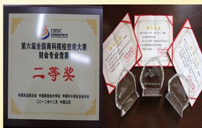
部分学生获奖证书