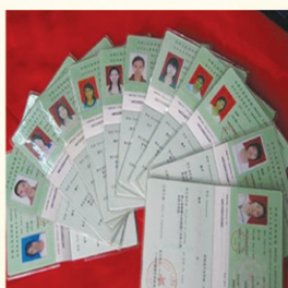
学生部分资格证书

建立了由安徽省审计厅人教处、审计学会、内审协会、用人单位、学生、家长及学院共同组成的人才培养质量评价机构，制定了全方位、多层次的评价体系和评价制度。